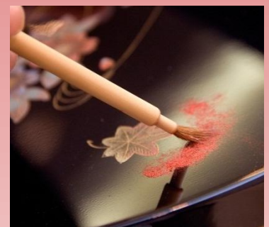
蒔絵体験/イメージ