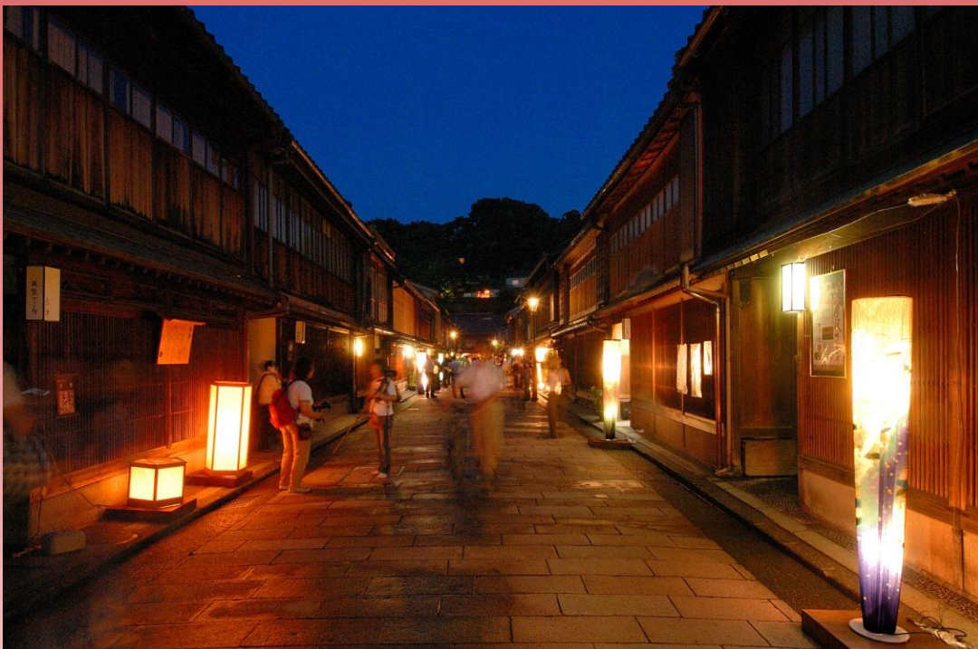
夜のひがし茶屋街/イメージ