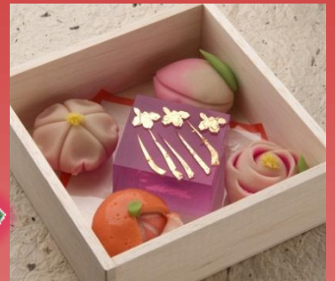
上生菓子/イメージ